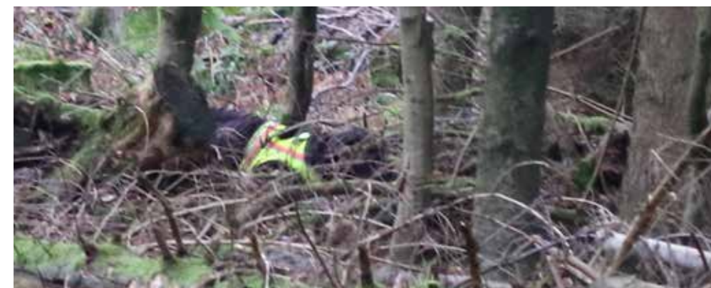
In moderatem Tempo quert ein Kronenhirsch schussgerecht ein Stangenholz vor dem Schützenstand (u.). Der spurlaute Stöberhund folgt erst einige Zeit später der frischen Fährte (l.).

Ein Rotrock , der sich klammheimlich davonstehlen will, wird durch einen spurlauten Wachtelhund verraten.