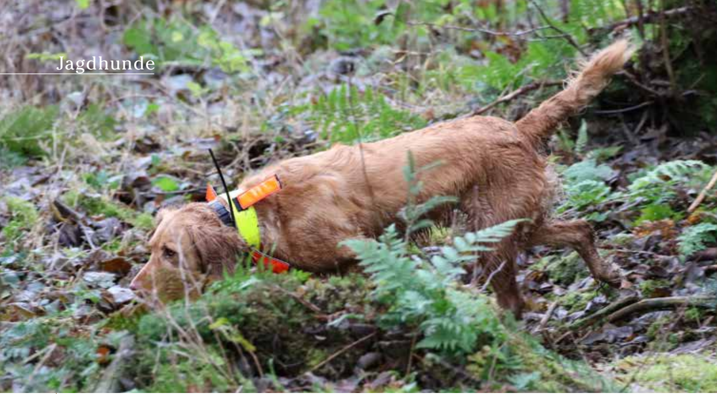
Eine Grundvoraussetzung für Hunde bei dieser Art der Bewegungsjagd ist die Arbeit mit tiefer Nase.

Innerlich winke ich auf eine Schussentfernung von über 100 Metern schon ab. Da Reineke aber einen guten Vorsprung vor seinem Verfolger zu haben scheint, ist er gemächlich unterwegs. Am Rand einer Rückegasse sichert er nach hinten. Schnell habe ich mich eingebaut, das Glas hochgedreht, und der Fuchs verendet im Knall.